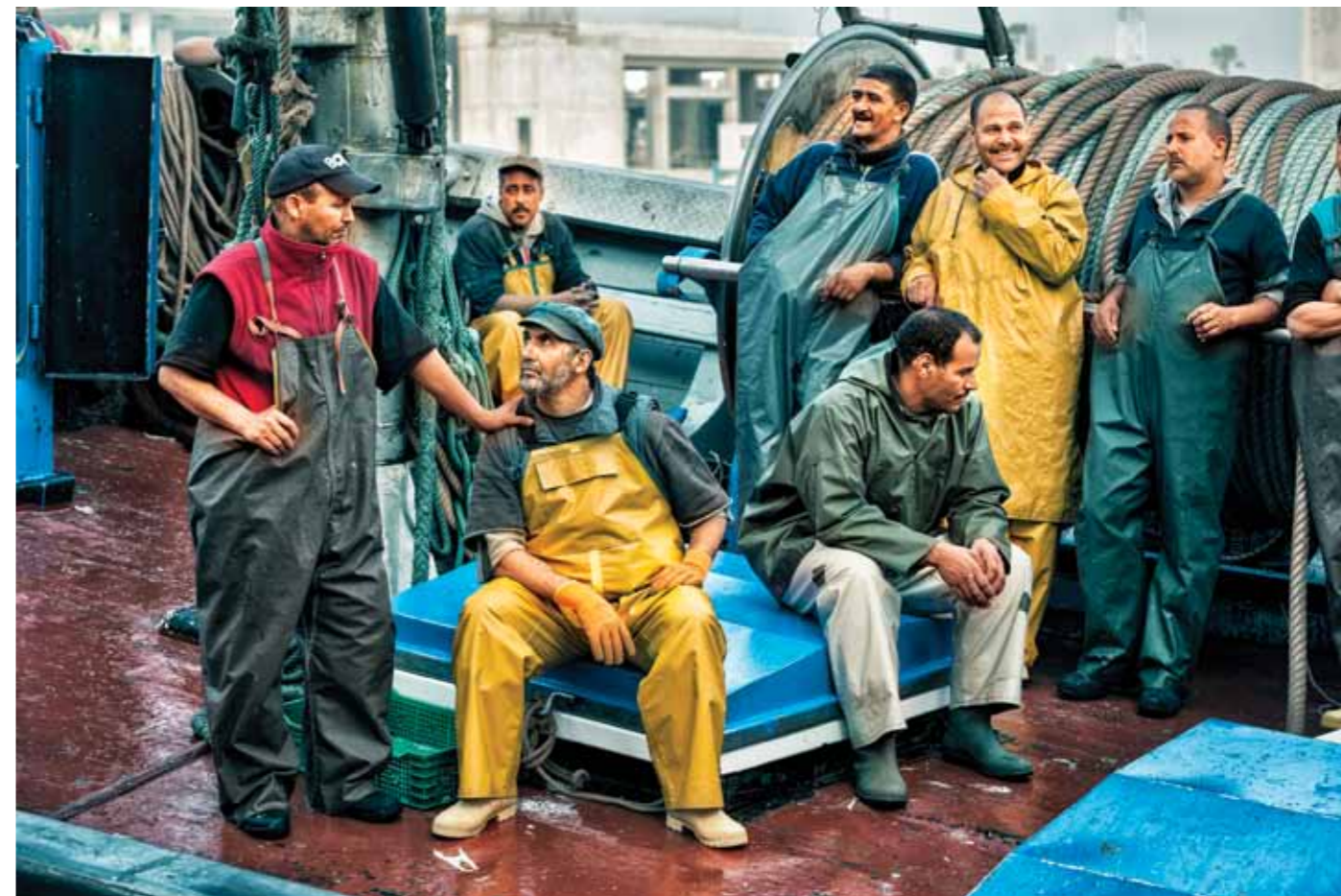
Casablanca Fishermen Casablanca, Morocco, 2017 1 / 15 67 x 100 cm