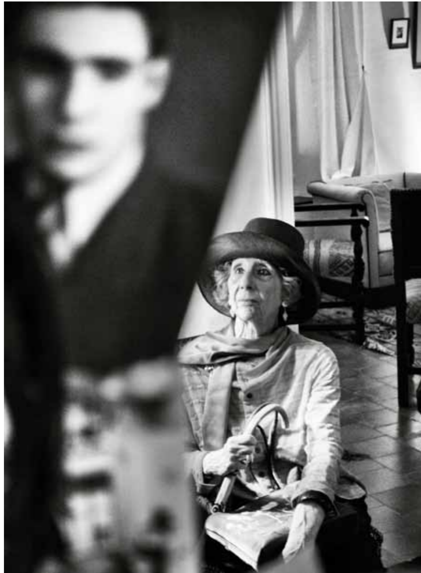
An afternoon in Tangier Morocco, 2016 1 / 25 40 x 27 cm