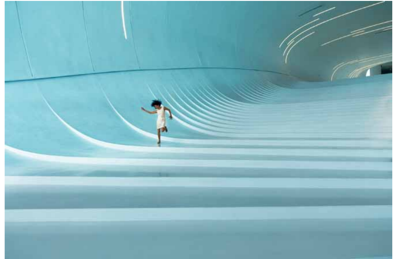
Expression, Baku Azerbaijan, 2017 3 / 20 44 x 65 cm