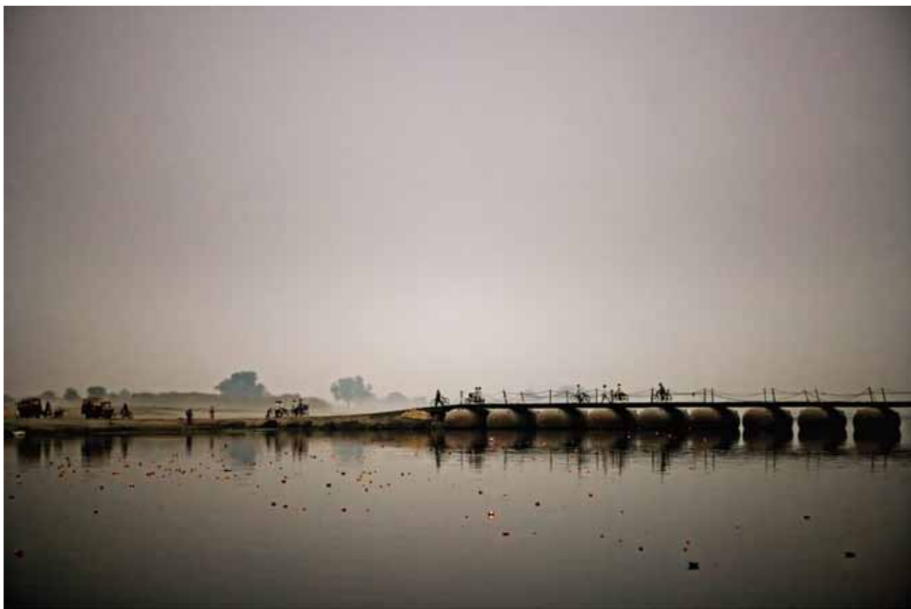
Pontoon Bridge Vrindaban, India, 2007 1 / 20 44 x 65 cm