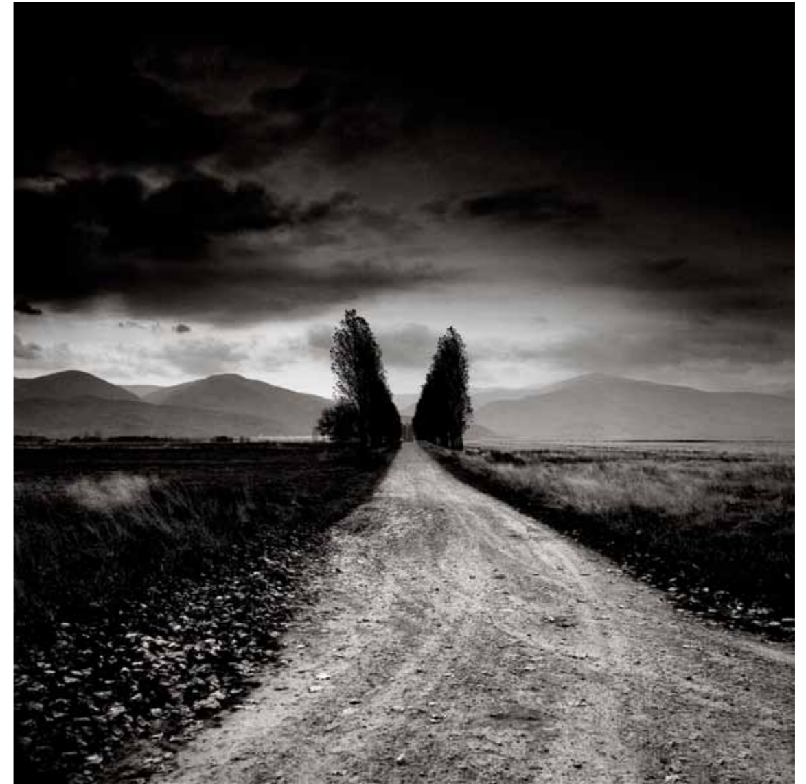
Transylvania Romania, 1996 1 / 15 71 x 71 cm