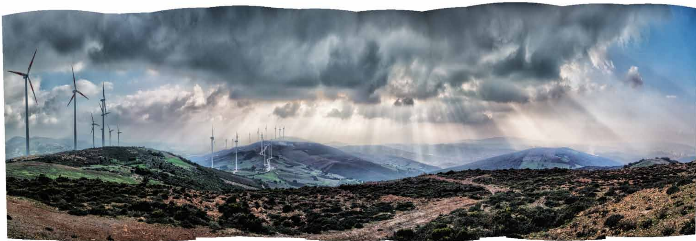
Windmills Tangier, Morocco, 2018 1 / 5 81 x 220 cm