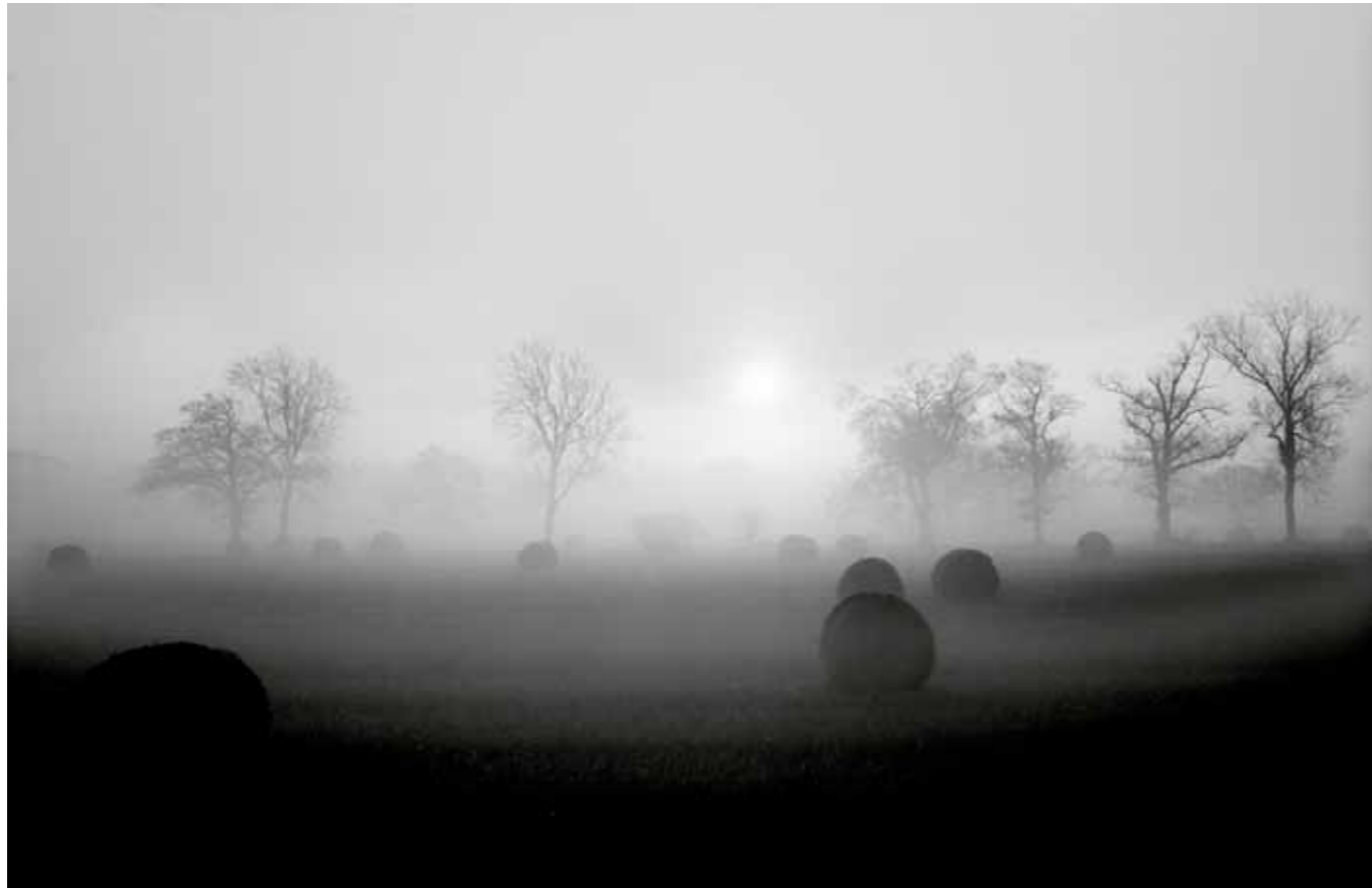
Hay Bales Sussex, UK, 1994 5 / 50 65 x 100 cm