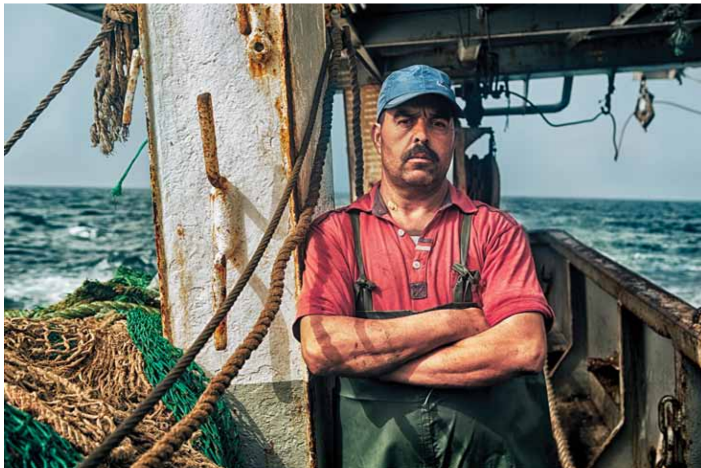
Fisherman Dakhla, Morocco, 2017 1 / 25 27 x 40 cm