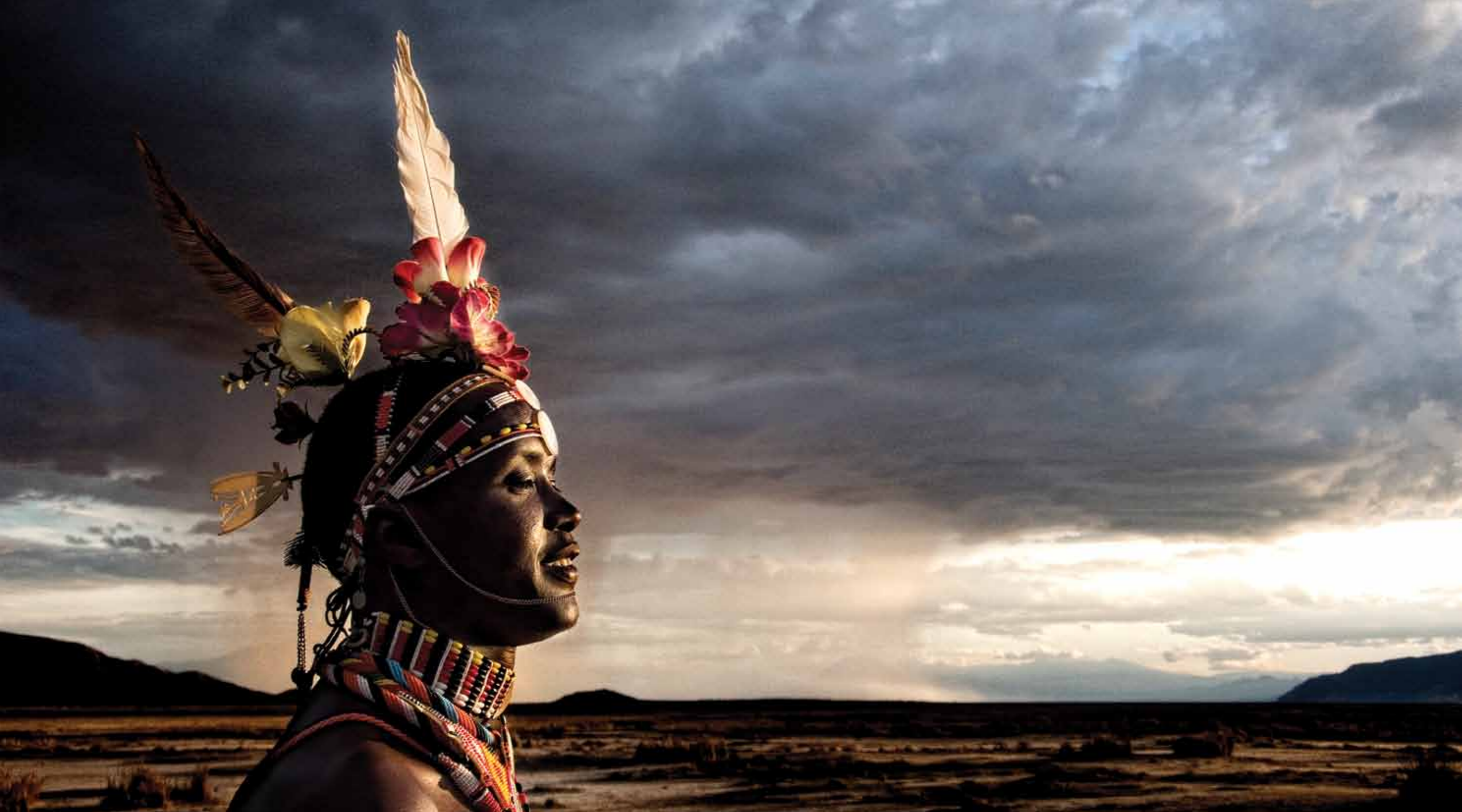
Maasai Warrior Tanzania, 2006 1 / 20 37 x 65 cm