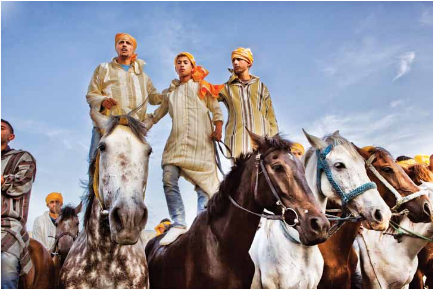
Horse wranglers, Mata Festival Morocco, 2017 1 / 15 67 x 100 cm