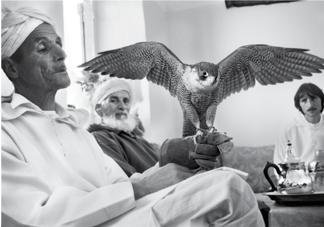
Falconer, Morocco, 2006