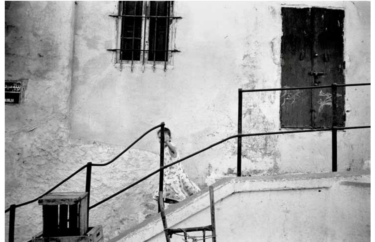
Girl, Kasbah Tangier, Morocco, 2008 1 / 25 27 x 40