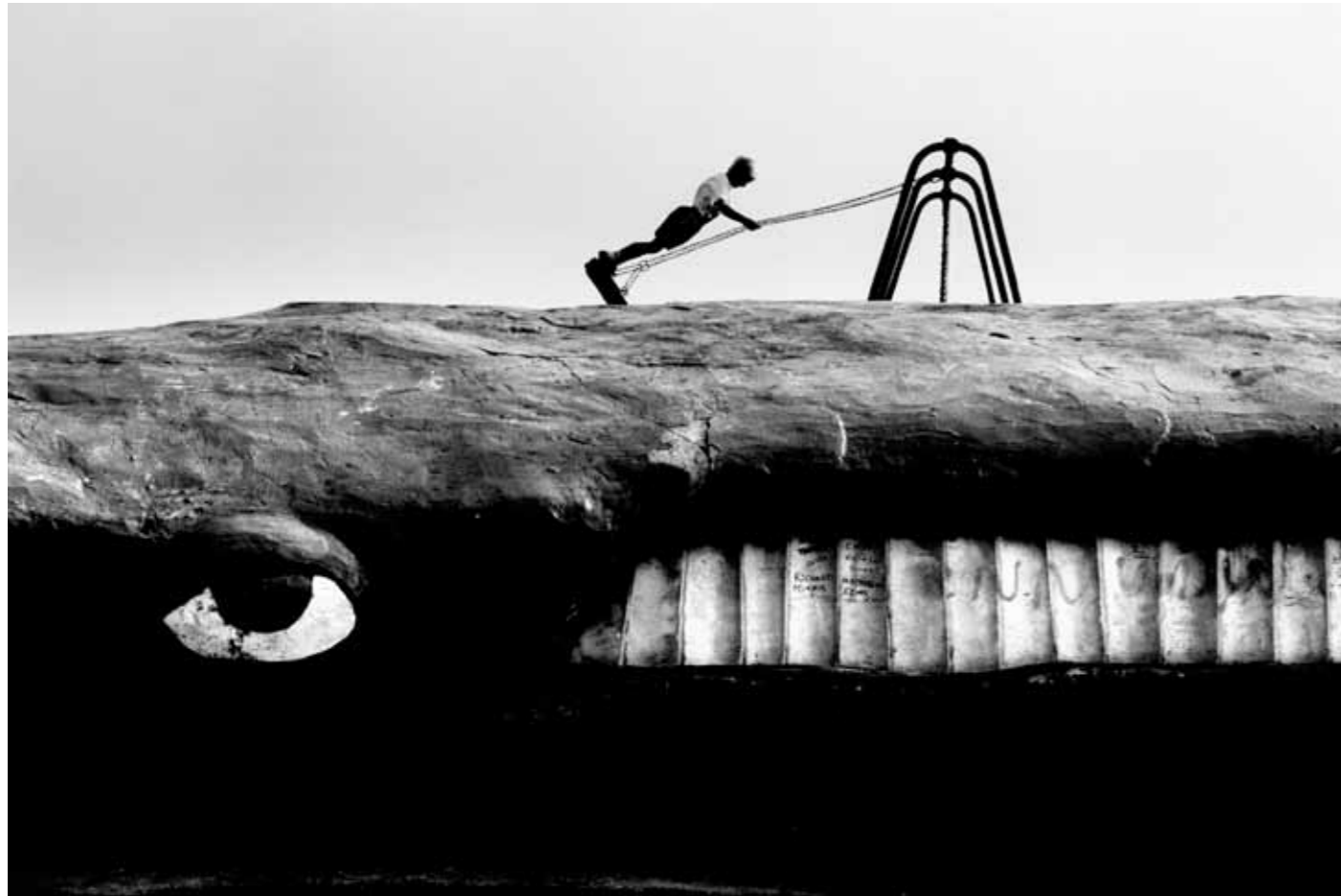
Whale in Wales, Port Talbot, Wales, UK 6 / 50 44 x 65 cm