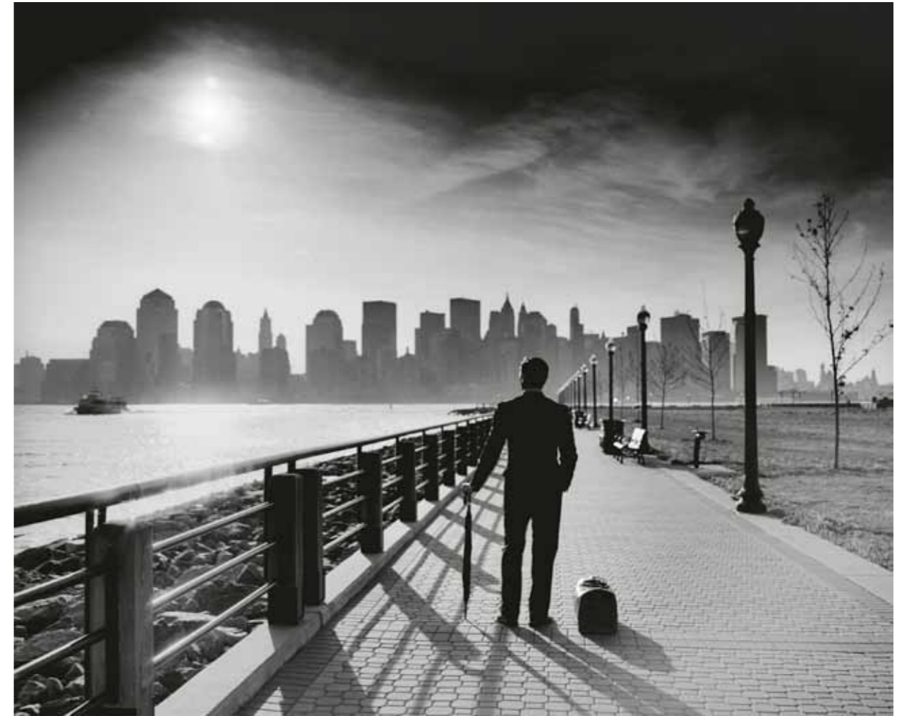
Man looking at New York New York, USA, 2002 2 / 20 50 x 62 cm