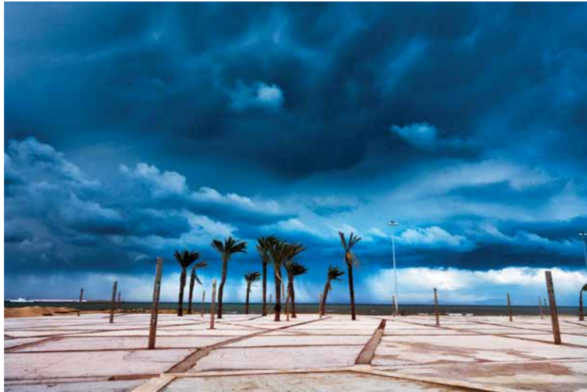
La Rocade Tangier, Morocco, 2016 1 / 20 44 x 65 cm