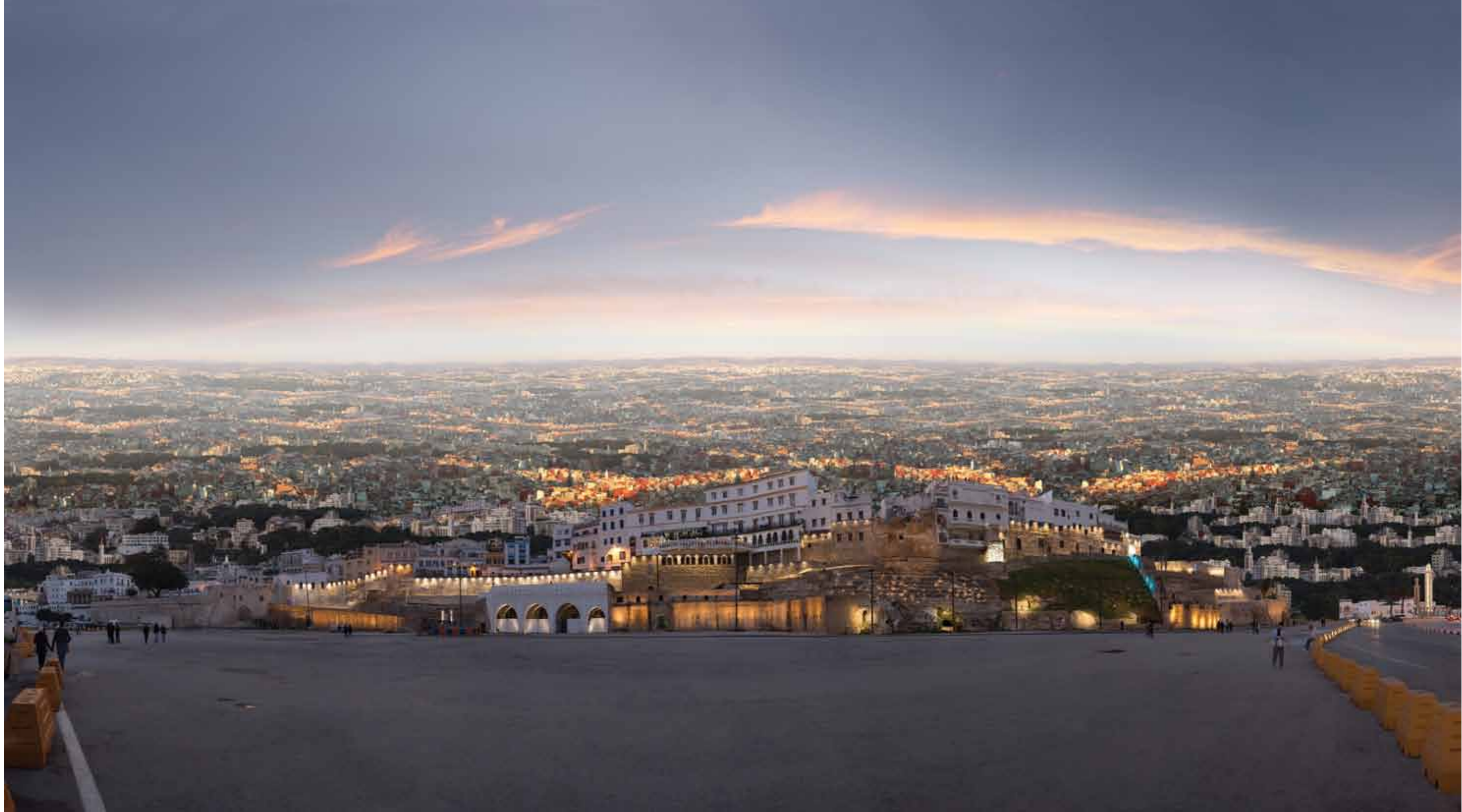
Tangier Surreal Tangier, Morocco, 2017 1 / 5 117 x 220 cm