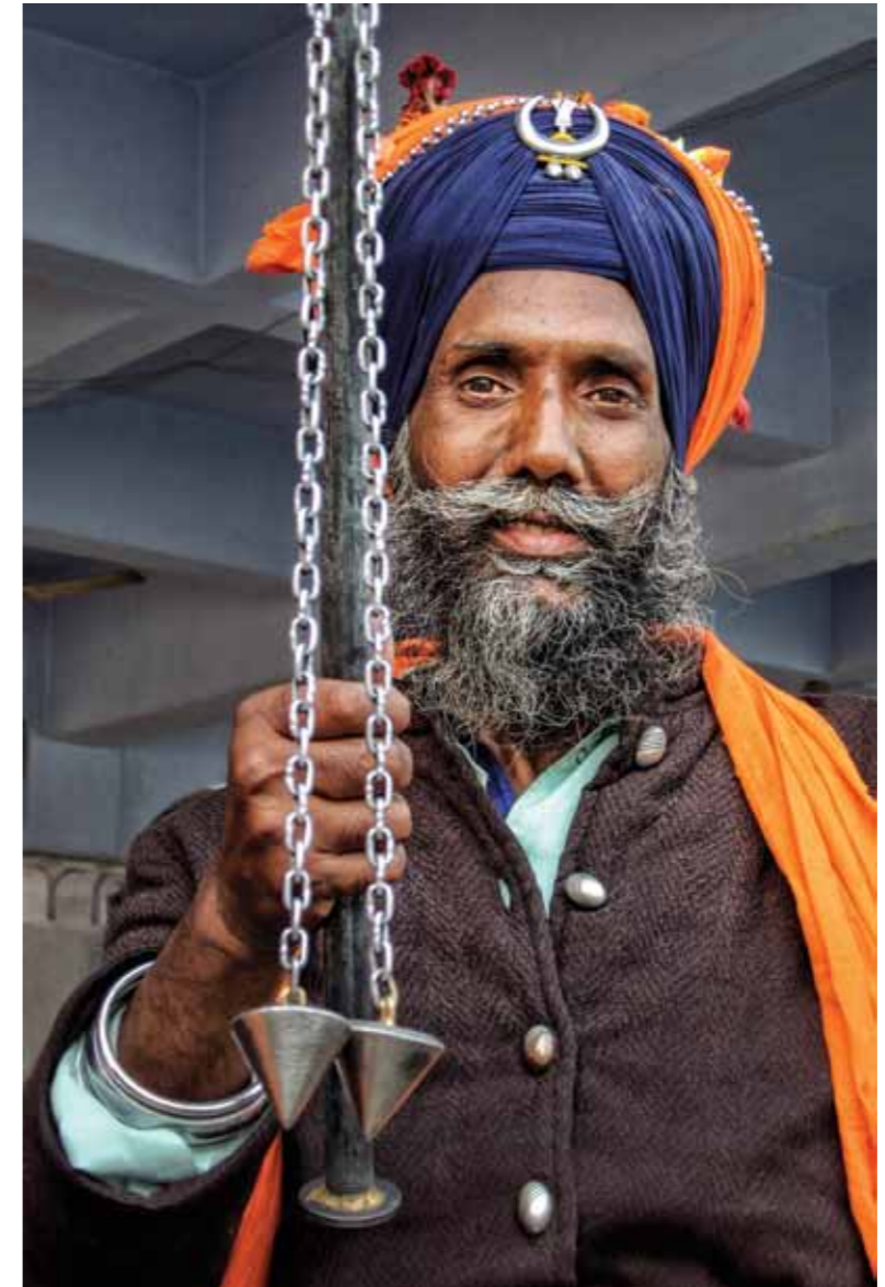
Sikh Warrior New Delhi, India, 2006 1 / 25 40 x 27 cm