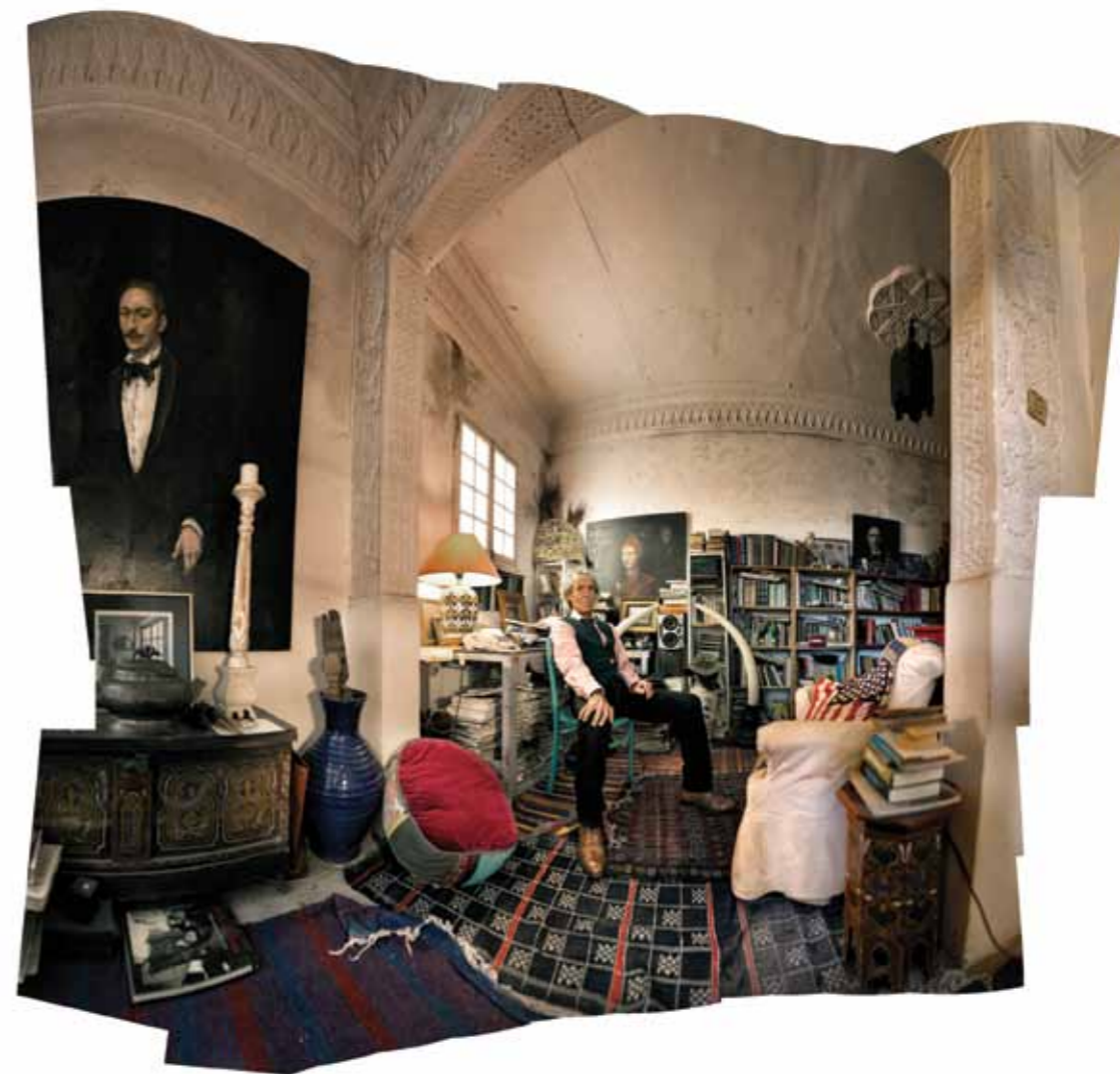
Francisco De Corcuera Tangier, Morocco, 2017 1 / 10 61 x 65 cm