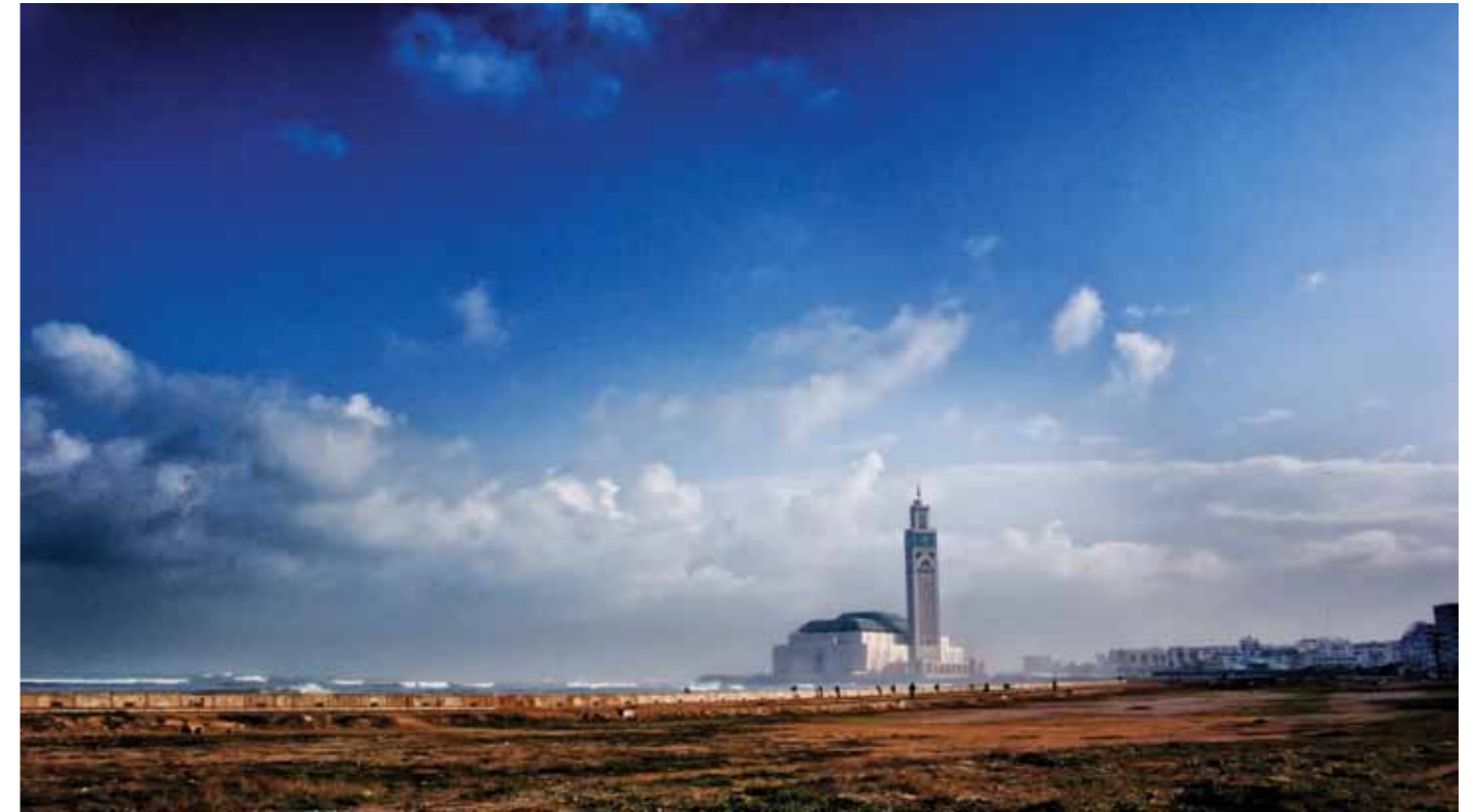
Hassan II Mosque Casablanca, Morocco, 2006 1 / 20 37 x 65 cm