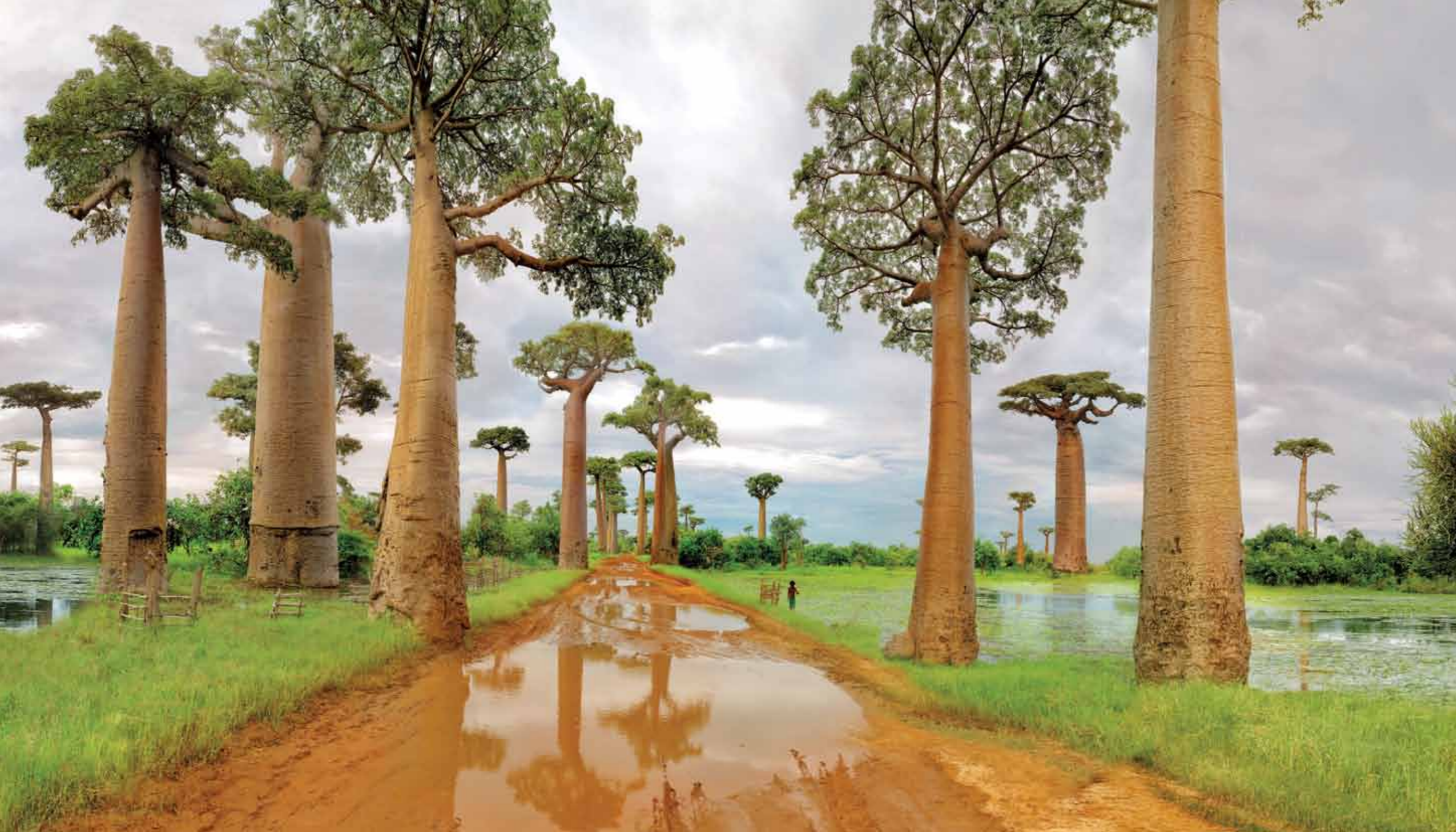
Baobab Trees Madagascar, 2014 2 / 5 117 x 205 cm