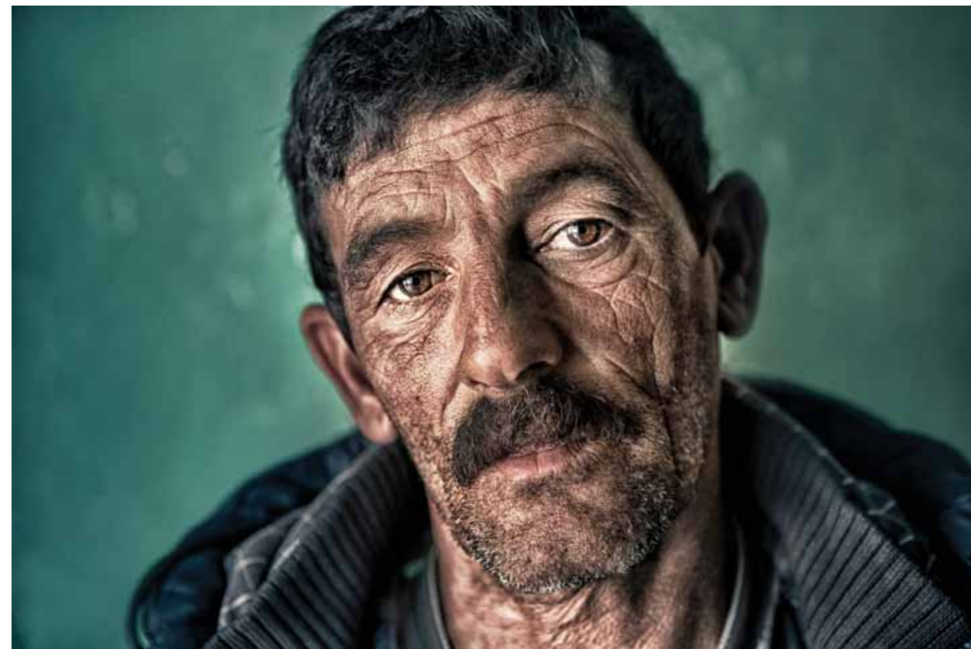
Proud Fisherman El Jebha, Morocco, 2017 1 / 25 27 x 40 cm