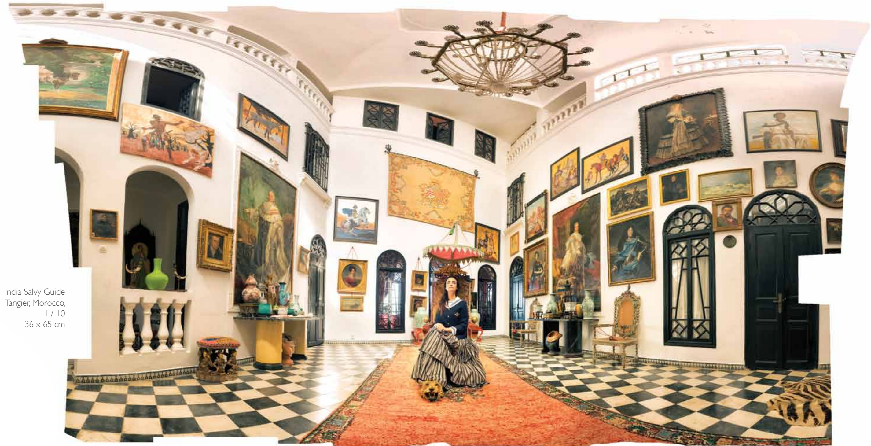
India Salvy Guide Tangier, Morocco, 1 / 10 36 x 65 cm