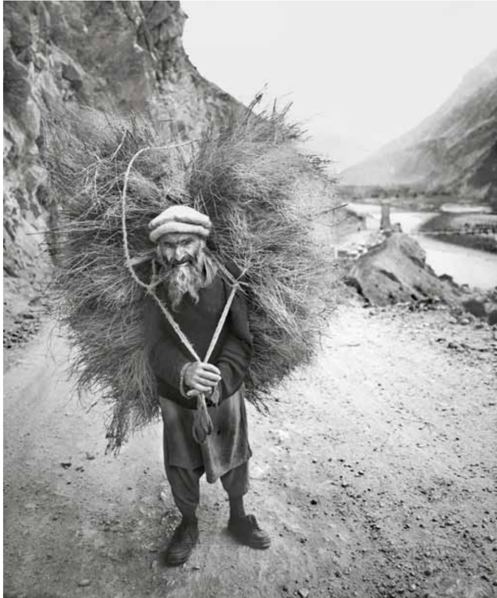
Old Man Karakorum Highway, Pakistan, 1988 2 / 50 74 x 60 cm