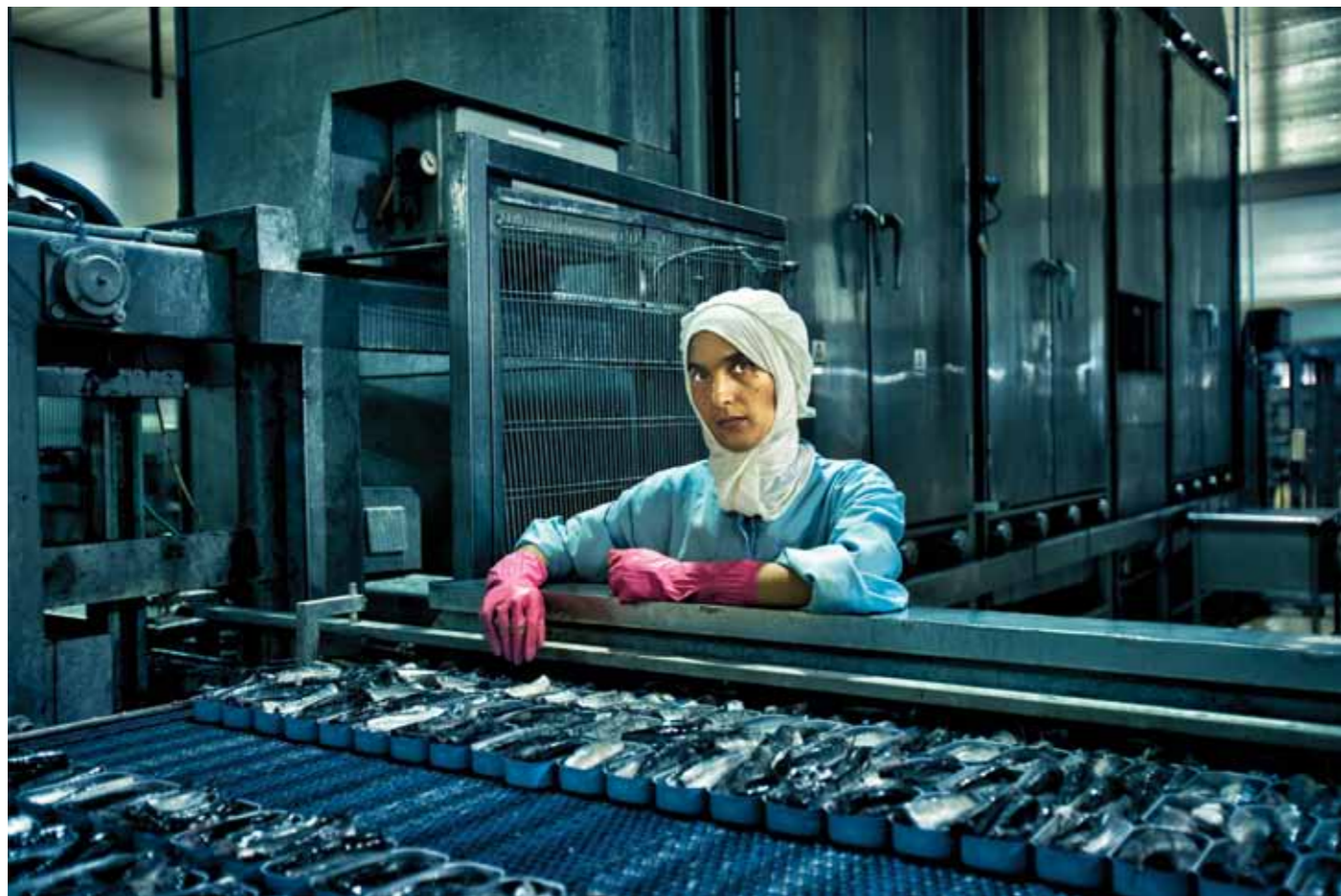
Sardine Worker Casablanca, Morocco, 2017 2 / 50 44 x 65 cm