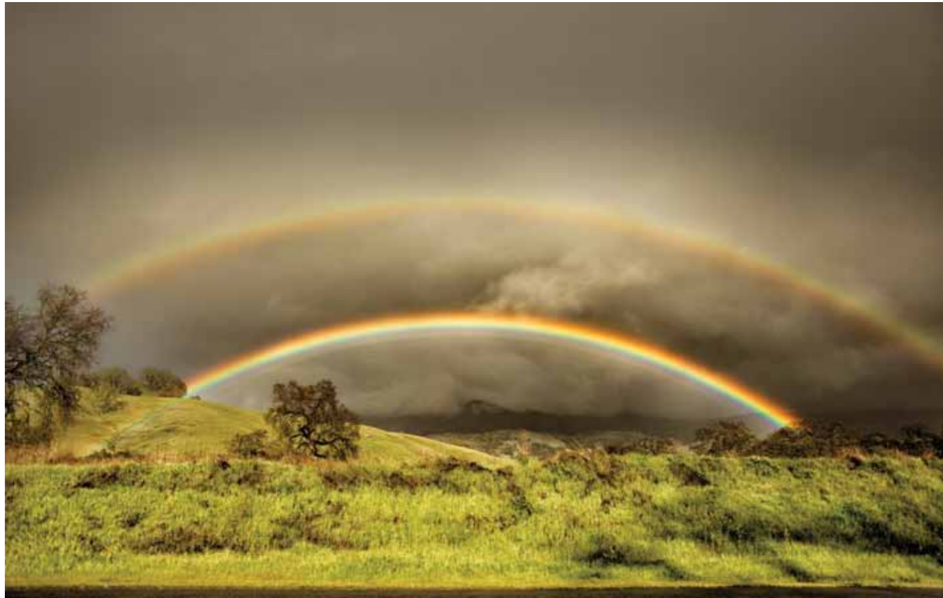
Rainbow, Napa Valley, California, USA, 2018 1 / 20 41 x 65 cm