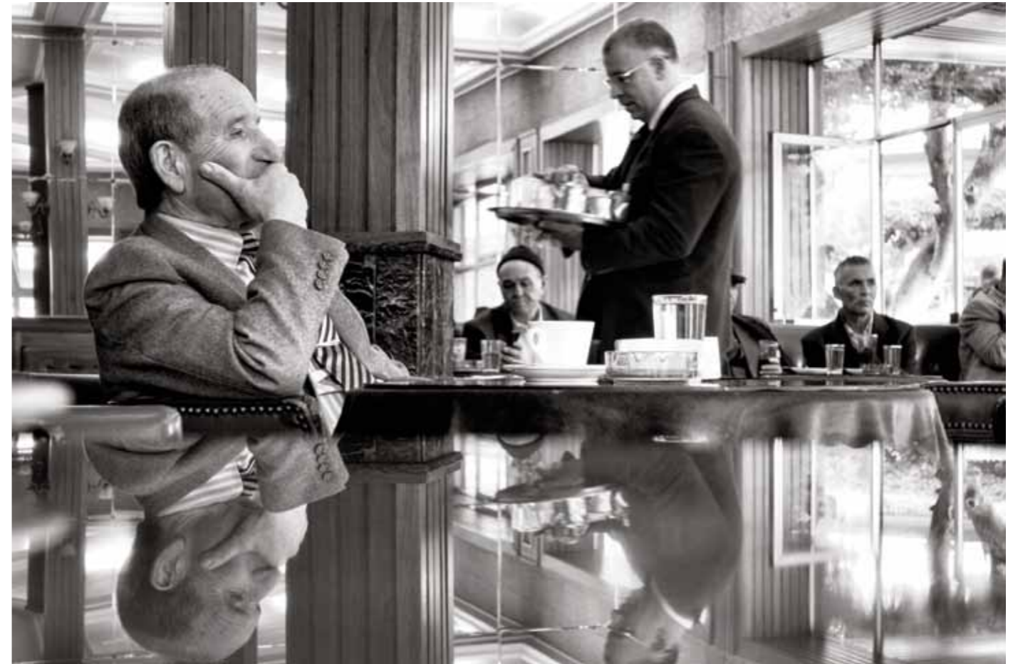
Café de Paris Tanger, Morocco, 2016 2 / 25 27 x 40 cm