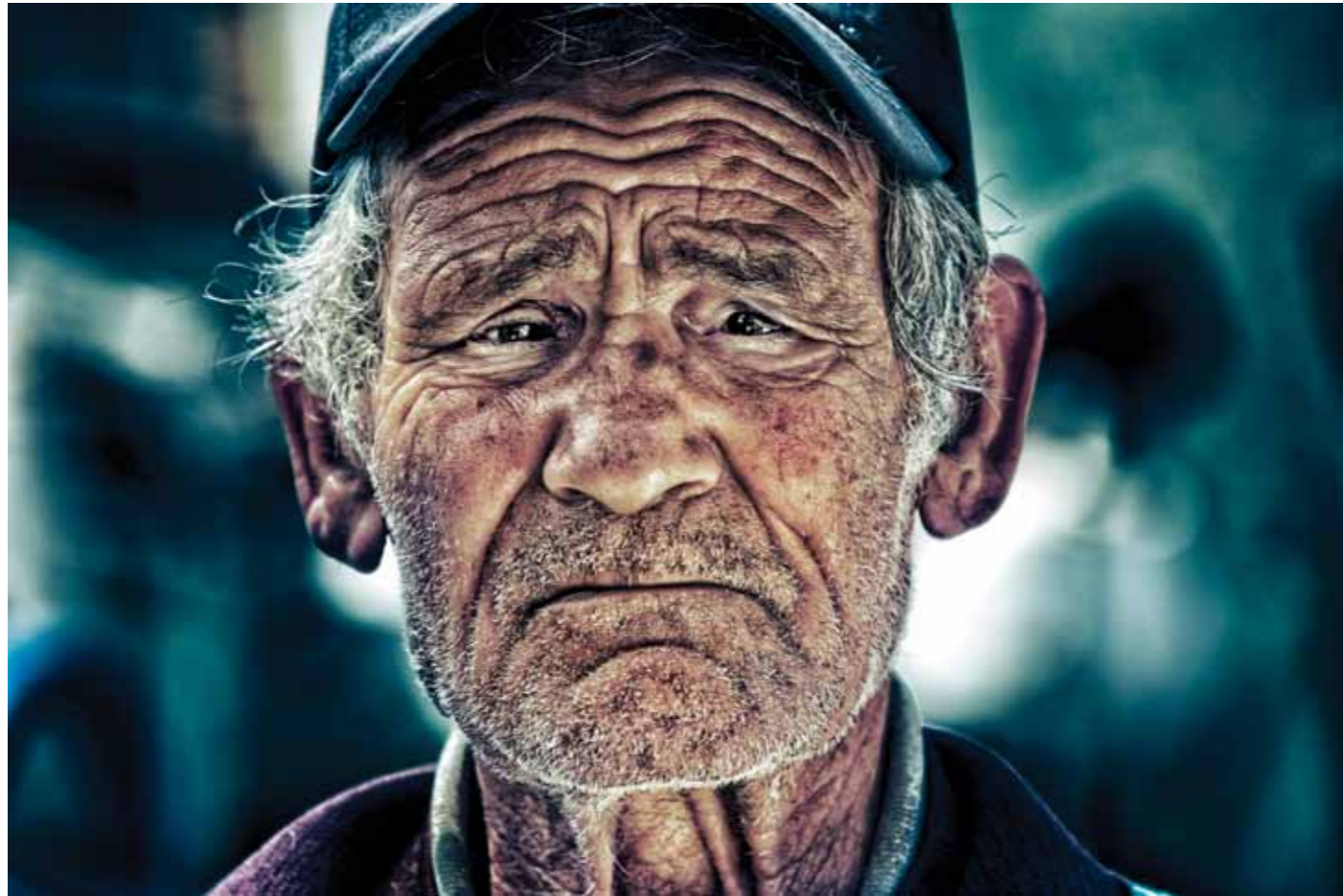
Weathered Fisherman El Jebha, Morocco, 2017 1 / 25 27 x 40 cm